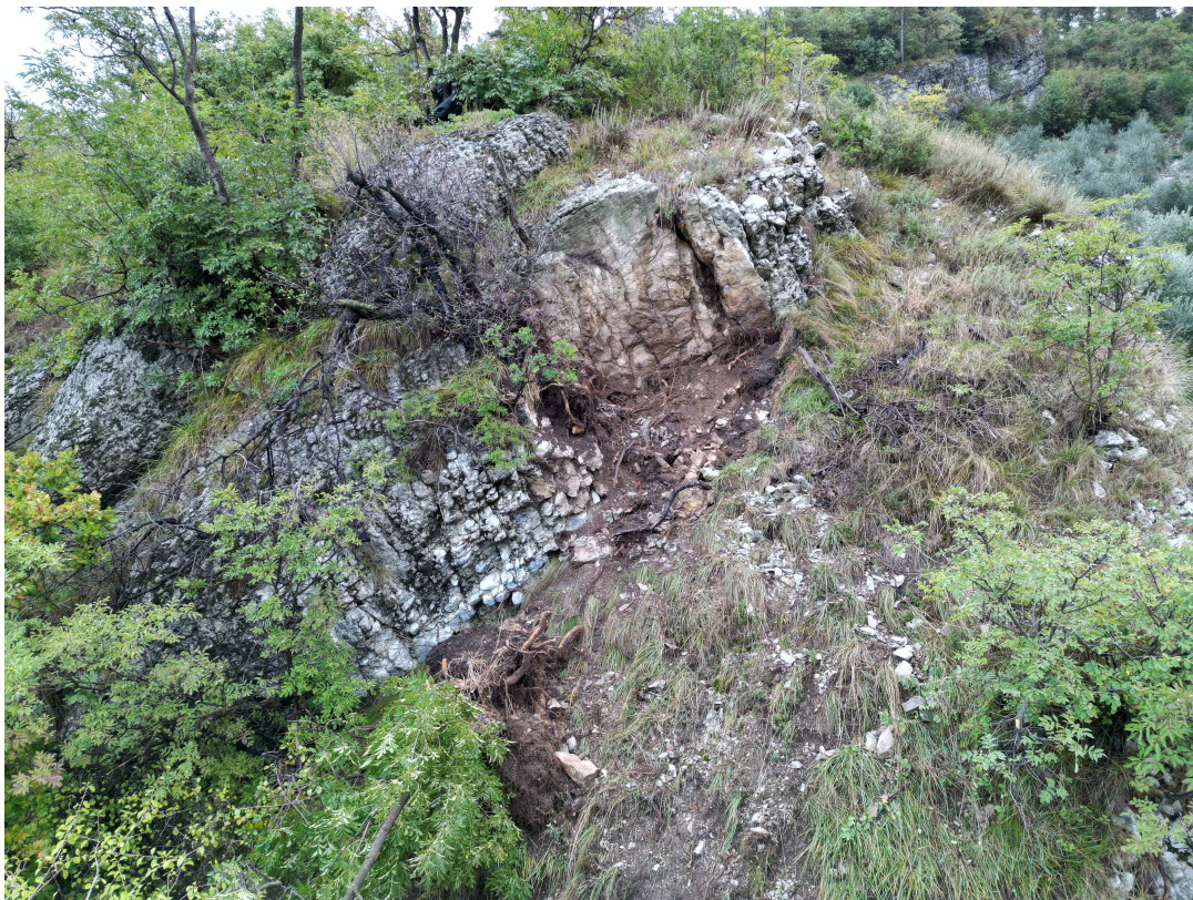
Figura 2: Immagine della nicchia di distacco prima delle operazioni di disaggio dei blocchi instabili.