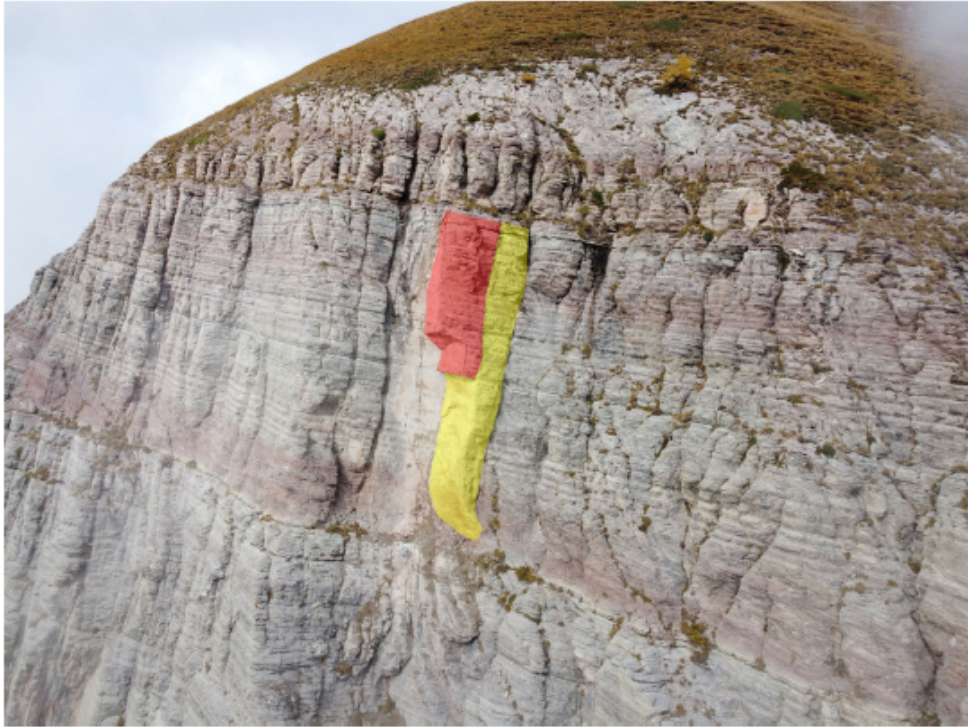
Fig. 3 - Porzioni instabili in parete (legenda nel testo)