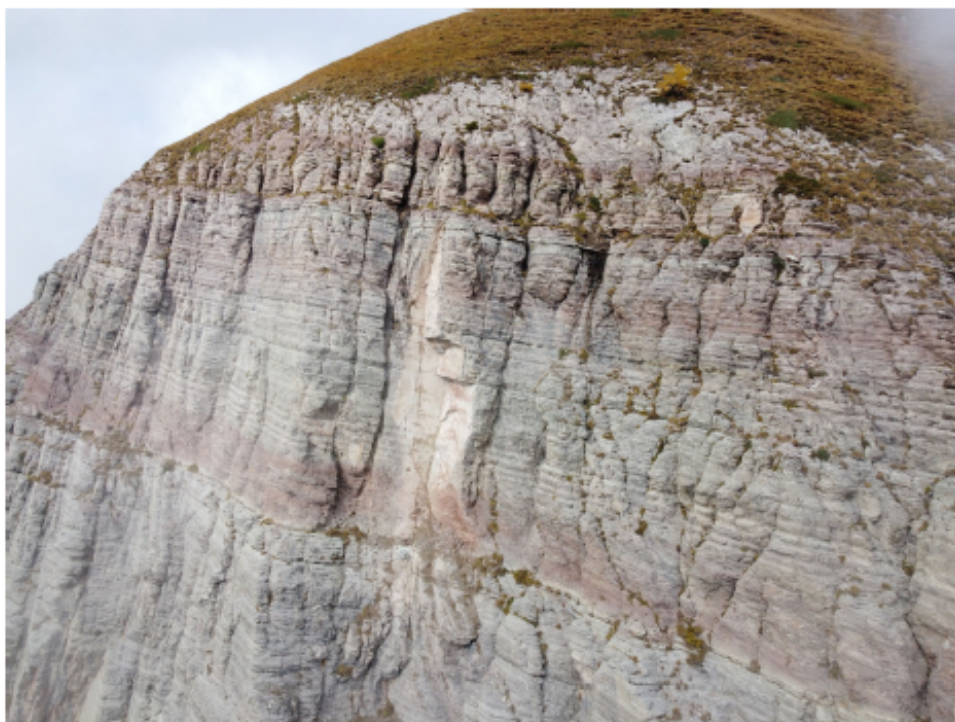
Fig. 1 – Punto di distacco