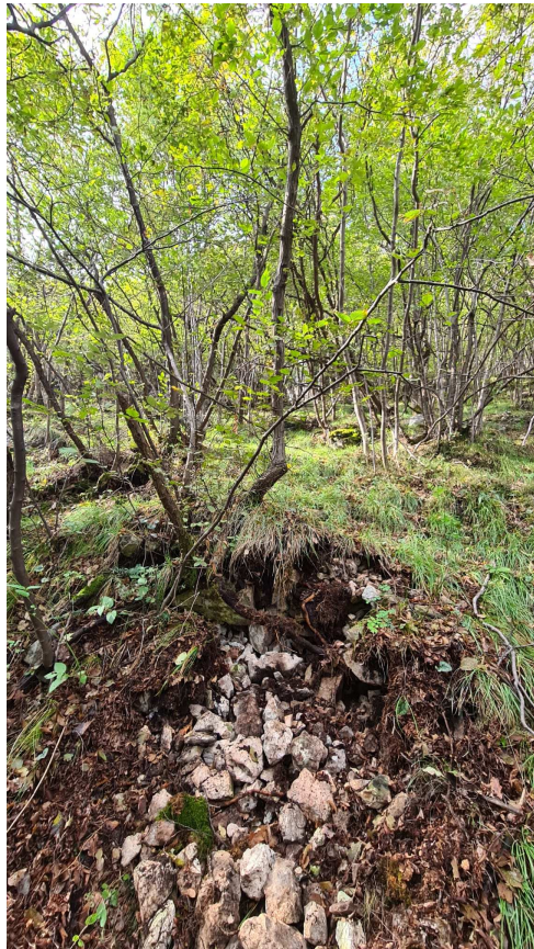
Figura 4: Particolare del ciglio superiore del punto di distacco