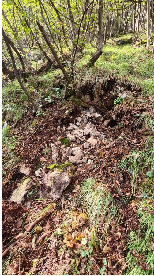
Figura 3: Particolare del punto di distacco