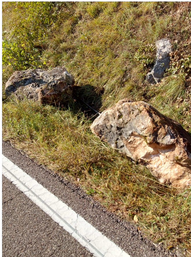
Figura 2: Blocchi che hanno raggiunto la viabilità provinciale